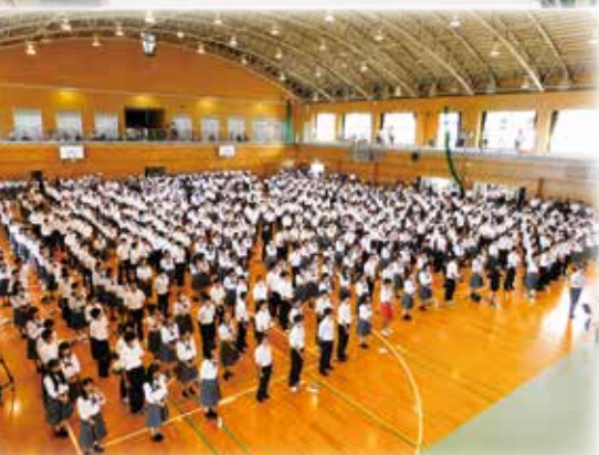
熊本県立八代中学校・八代高等学校