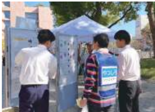
やつしろ防災フェスタ2023で 商店街防災マップを披露する様子