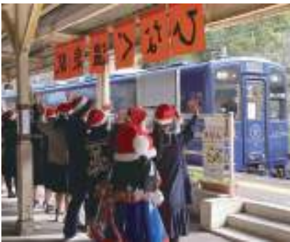
肥薩おれんじ鉄道とのクリスマスイベント