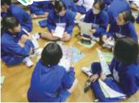
SDGsすごろくを使って世界の抱える課題を勉強します。