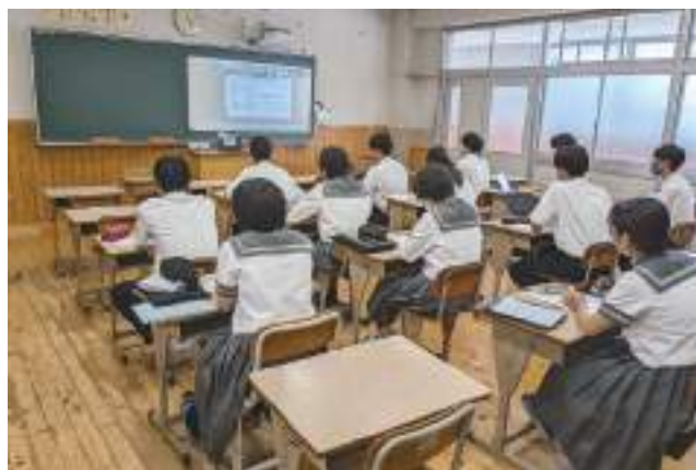
グローバルアクションミーティングオンライン講演会 (「ChatGPT: 未来はAIが創るのか?」の様子)