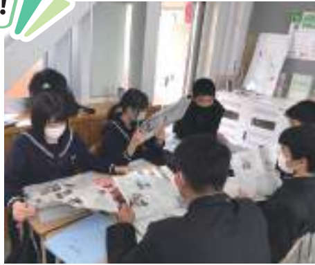
新聞をSDGsの視点から読み、社会問題を考えます。