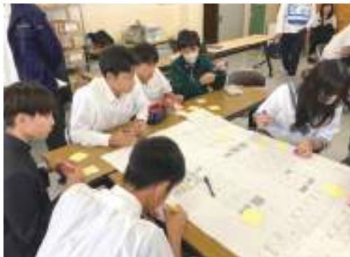
避難所運営について、松高校区自主防災会 やNHK、熊本大学の皆さんと一緒に考える

「どこでも活躍できる人材」 「メッセージを持った人材」のこ とを本校では「グローバル人材」 と名付け、その育成のため、 以下に紹介する3つの プログラムを展開して います。 これらのプログラムへの 参加により、グローバル 人材に必要な知性と品 性、豊かな感性と闊達 な行動力を育みます。