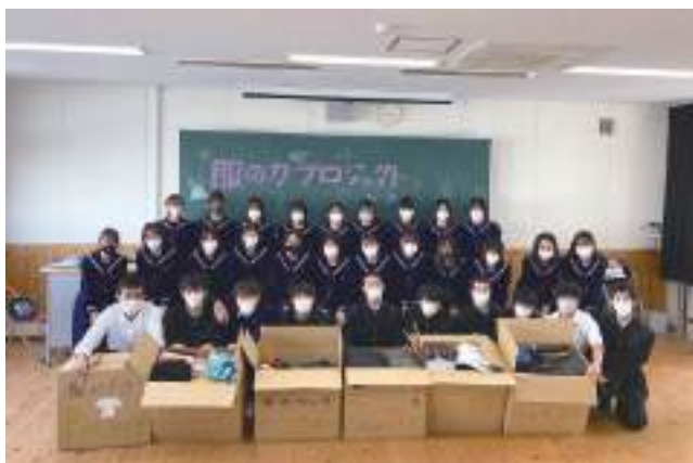
“届けよう、服のチカラ”プロジェクト (300着ほどの子ども服を回収)