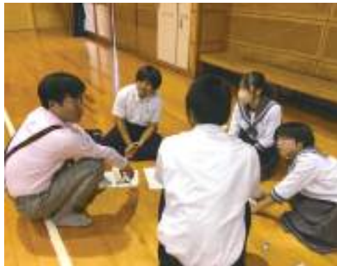
八代市×熊本大学×八高の連続講義 ⇔1年生と2年生で意見交流