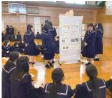
探究活動成果発表会