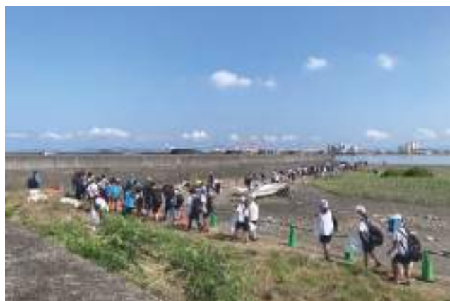
八代海河川浜辺の大そうじ大会 (100名以上参加)