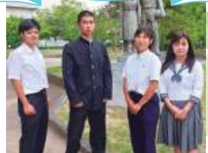
M・Tさん (水俣一中出身)