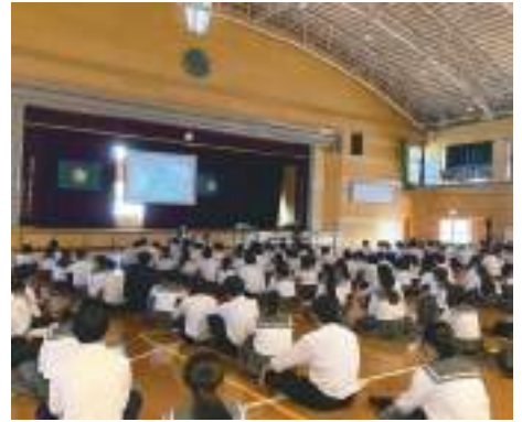
その道の専門家から地域のことを学び、SDGsの視点で地域の良さを知ります。