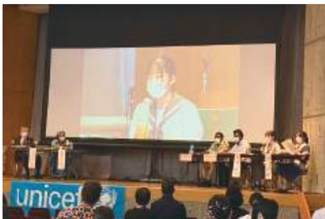
アフリカの留学生との意見交換 (第30回『アフリカの子どもの日』in Kumamoto)